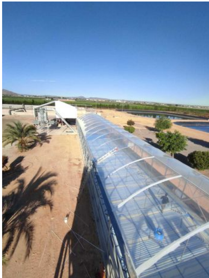
Imagen de la práctica innovadora

El prototipo de la EDAR de San Javier (Murcia) va a demostrar el aprovechamiento de todos los lodos generados en la depuradora para producir energía necesaria para la planta, sustituyendo así los combustibles fósiles que actualmente se utilizan, y además genera excedente de energía eléctrica y un bioproducto empleado como enmienda agrícola.